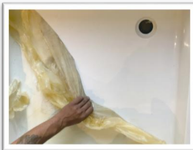
Enlèvement du film de protection MASK-OFF