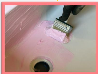
Pose du MASK OFF